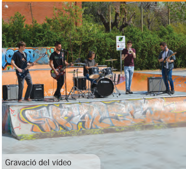
Gravació del vídeo