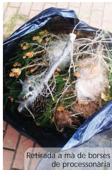
Retirada a mà de borses de processonària

Així al clavegueram municipal es realitzen revisions permanents i intervencions als mesos de juny i octubre adreçades al control de rosegadors i paneroles. A les escoles públiques es realitzen revisions als mesos d'abril, juliol i desembre i sempre que són requerides per la direcció dels centres. Per raons evidents a les