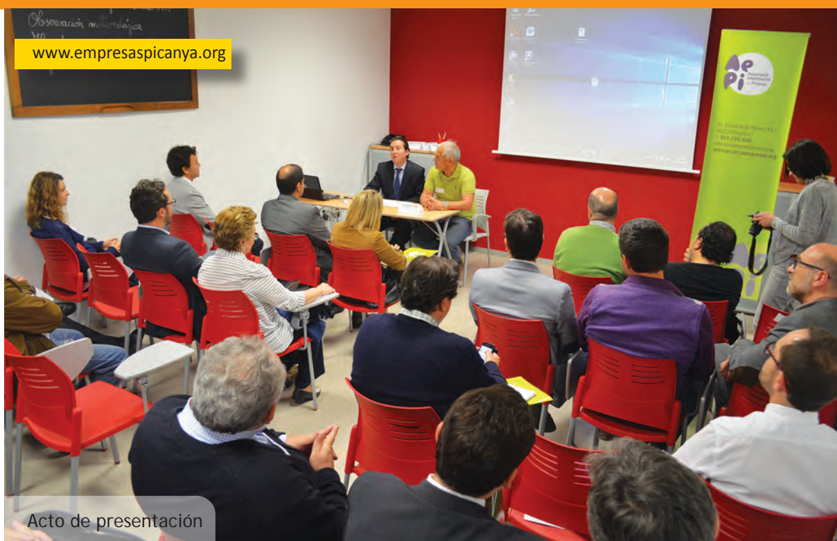
Acto de presentación