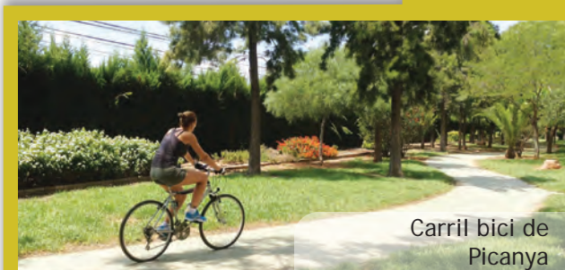
Carril bici de Picanya

La Conselleria ha destacat que la conformació d'una xarxa ciclista de rang autonòmic forma part d'una política activa de mobilitat sostenible impulsada per la Generalitat, basada en un ús més racional del vehicle privat, la reducció del soroll o la prioritat dels viatges a peu, amb bici o en transport públic.