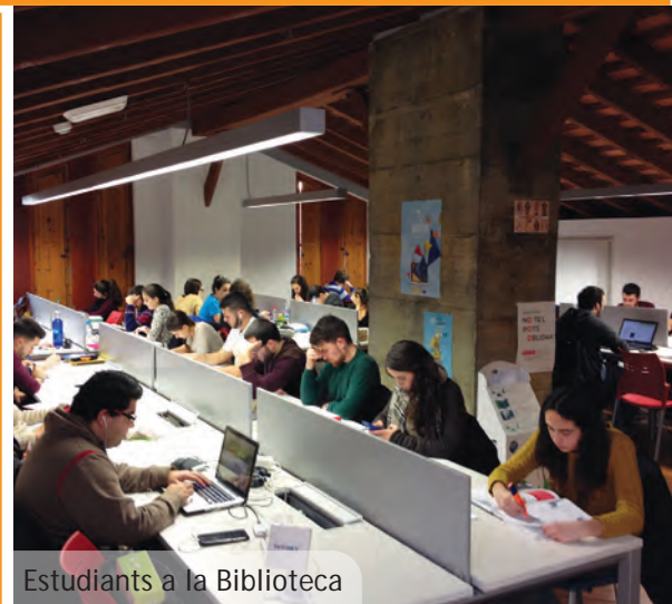
Estudiants a la Biblioteca

Des de l'Ajuntament de Picanya s'ha decidit anar un pas més enllà en la promoció dels grups joves picanyers i en eixe sentit s'ha encetat una nova via de col·laboració amb la producció de vídeos musicals. El primer grup que ha dit sí a la proposta ha volgut posar en imatges una de les seues cançons han estat "Zuvak" que ja tenen publicat el vídeo del seu tema "Mente abierta" al web (PicanyaTV), i Facebook municipals i també als canals del propi grup. La intenció és continuar esta col·laboració amb els altres grups del local.