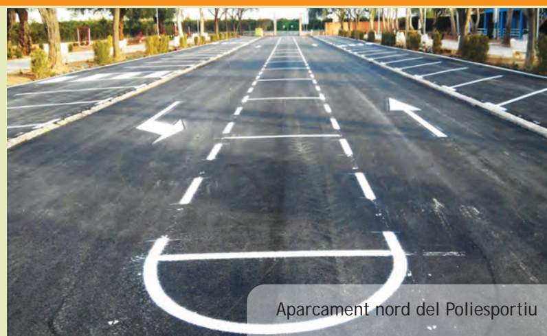
Aparcament nord del Poliesportiu