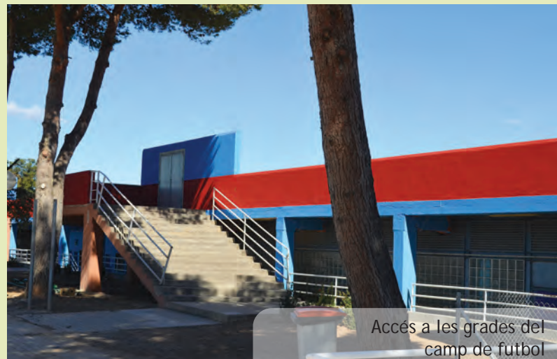
Accés a les grades del camp de futbol

Al plenari del 28 de gener d'enguany, el ple municipal va aprovar el pressupost municipal per a este 2016. En eixe pressupost, per primera vegada, enguany, es contemplava que un 25% de la partida destinada a inversions s'acordaria entre tots els grups municipals presents al plenari com a representats directes del poble de Picanya. Després d'una primera reunió de posada en comú, el dia 11 de febrer els representants dels diferents grups polítics al Ple municipal van acordar destinar este 25% del pressupost total d'inversions a la millora del servei de clavegueram del Poliesportiu que es connectarà de forma directa a la xarxa de clavegueram del nucli urbà.