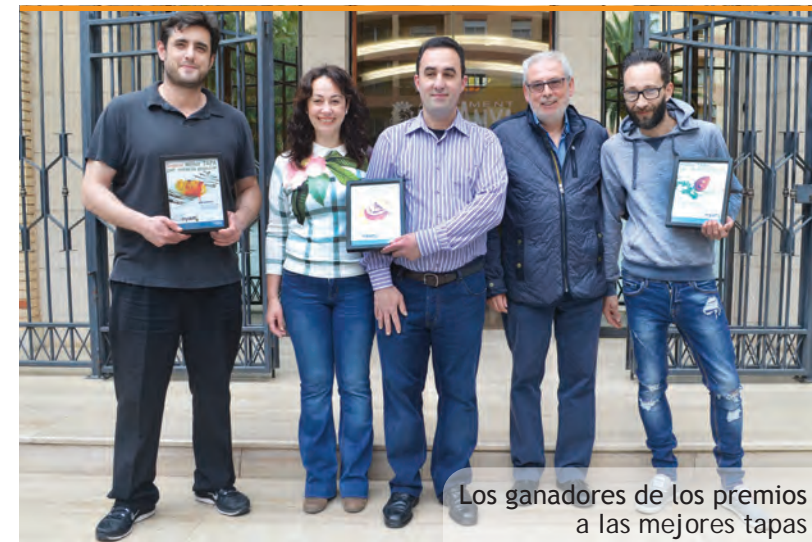
Los ganadores de los premios a las mejores tapas

No queda por tanto más que desear que la "PicaNYAM! Ruta de la Tapa por Picanya" siga creciendo en participación, respuesta de público y calidad. Un reto siempre complicado pero que, con seguridad, sabrán afrontar nuestros hosteleros para deleite de todos y todas.