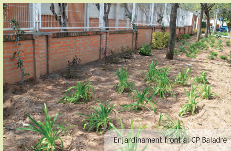
Enjardinament front al CP Baladre

A principi del mes de març es van completar les obres de reasfaltat de tota la zona d'aparcament nord (el de la zona del restaurant) del Poliesportiu Municipal. En esta mateixa intervenció també s'ha procedit al repintat de la senyalització vial que, amb el temps havia desaparegut, i que permet optimitzar l'ús de tota la superfície. Esta intervenció està en la línia de la ja realitzada a l'aparcament sud (junt a les pistes de tennis) i completa l'actuació de millora de les dues zones d'estacionament de vehicles del Poliesportiu Municipal.