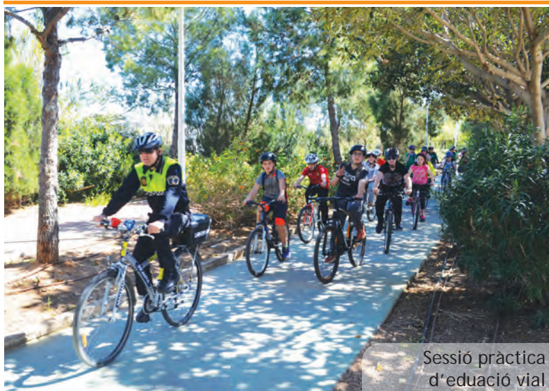
Sessió pràctica d'educació vial