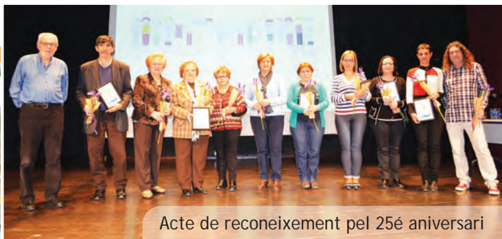
Acte de reconeixement pel 25è aniversari

Foto galeria disponible al web municipal