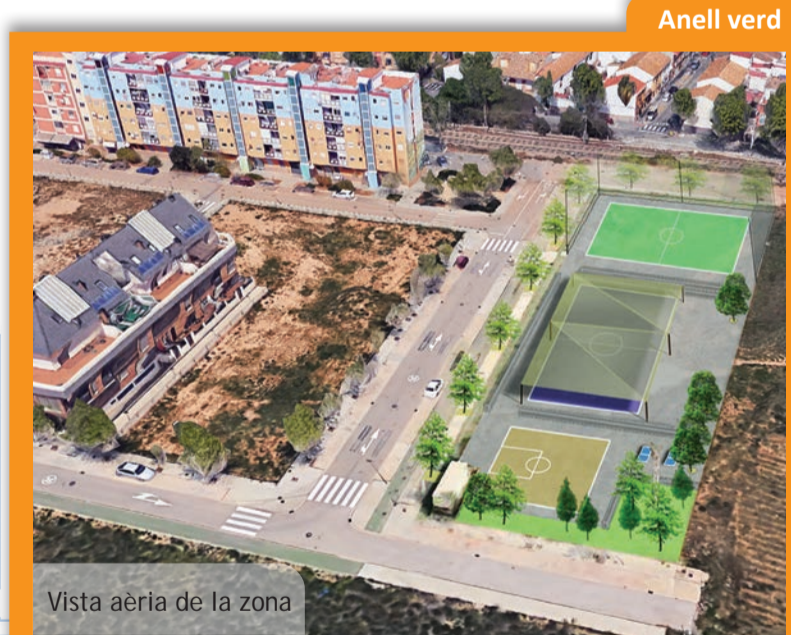
Vista aèria de la zona