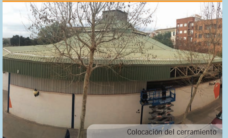
Colocación del cerramiento