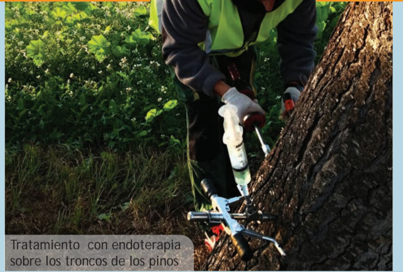
Tratamiento con endoterapia sobre los troncos de los pinos

caigudes està en els repetits episodis de fortes pluges i vent molt intens després de molts mesos de sequera. Tot i que els arbres havien sigut podats i controlats pels serveis de jardineria, la quantitat de pluja caiguda en períodes molt curts (tot i ablanint el sòl) i el vent (amb ratxes superiors als 80 km/h) han superat la capacitat de resistència d'estos arbres. Un fenomen repetit a tots els pobles de les nostres rodalies.