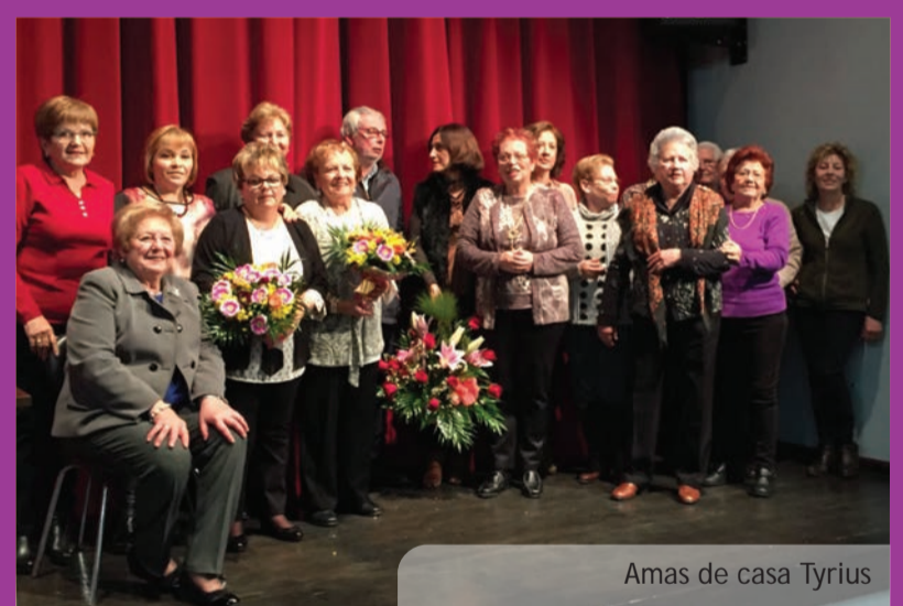
Amas de casa Tyrius