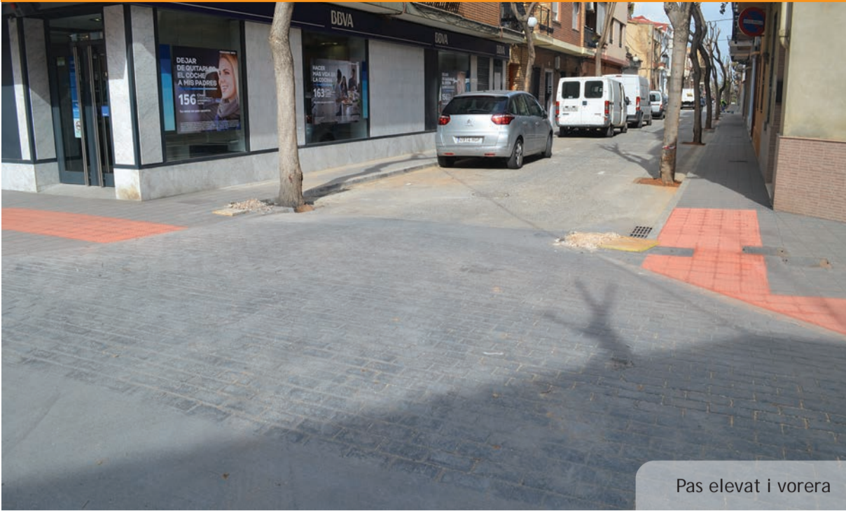
Pas elevat i vorera