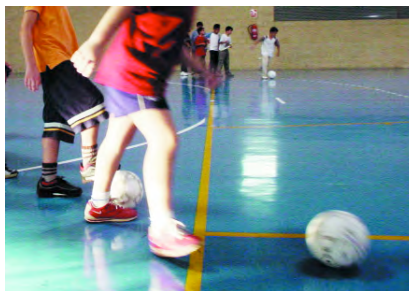
Futbol sala al Pavelló

Des de l'organització es vol destacar el comportament esportiu de tots els equips i el gran nivell de joc en aquesta primera Copa en què s'hi han disputat 36 partits, s'hi han marcat 263 gols i sols s'hi han assenyalat 29 faltes.