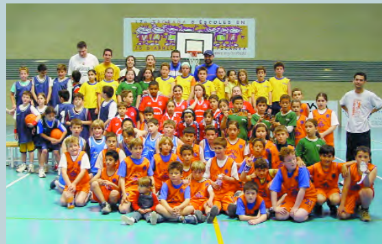
Els equips participants en la foto final

La jornada és preparada a consciència pels professors dels centres escolars, els quals col·laboren al llarg de la jornada, junt als voluntaris de l'Associació El Melic, els del Club d'Atletisme i els àrbitres de la competició escolar, per tal que tota la logística necessària per a un esdeveniment esportiu d'aquestes característiques funcione a la perfecció.