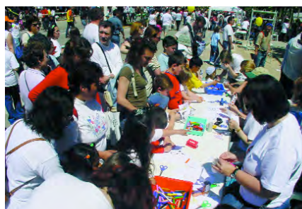
Tallers a ple rendiment