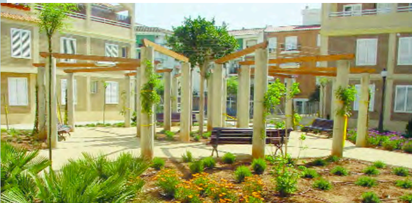
Pèrgola central de la plaça de la Concòrdia

La font comptarà amb tots els sistemes de filtrat i de depuració d'aigües per al seu manteniment automàtic. A més a més l'aigua, una vegada neta, tornarà a ser reutilitzada per la font, per tal d'estalviar recursos naturals. També s'hi instal·larà un sistema anemomètric que mesurarà la velocitat del vent i evitarà que l'aigua dels sortidors esguite fora dels gots.