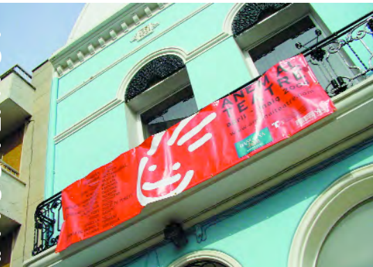
Pancarta anunciadora de la campanya "Anem al teatre" al Centre Cultural