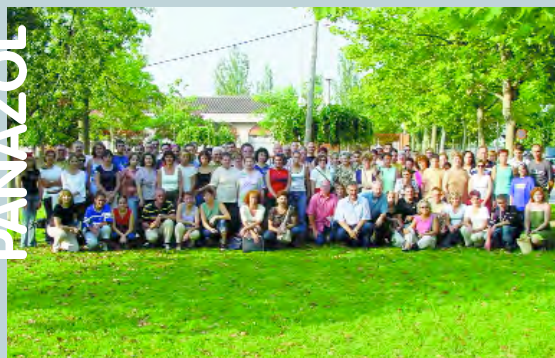
Panazolencs i picanyers en la visita de 2002

Para más información sobre estos programas el Ayuntamiento ha abierto una oficina de gestión sita en Pl. España 7 a la que puede dirigirse cualquier persona interesada.