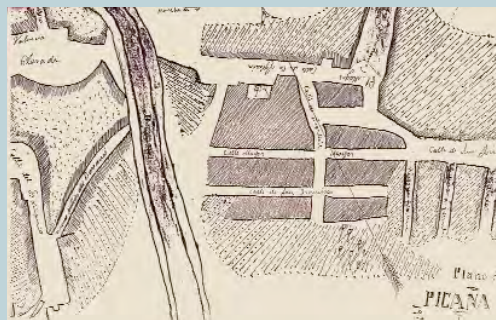
Plànol de Picanya realitzat abans de 1911

En la segona part, els historiadors analitzen les diferents tipologies de les construccions a Picanya. Repassen la tipologia de la casa de poble (de pati sencer, de mig pati, la casa amb escaleta, la casa de jornal...), fins a arribar a solucions més actuals com els habitatges adossats o les cases de pisos. Els diferents estils arquitectònics presents als nostres carrers també hi són analitzats (l'eclecticisme, el modernisme, l'Art Déco, el racionalisme...) en una clara invitació a mirar les nostres façanes amb major interès.