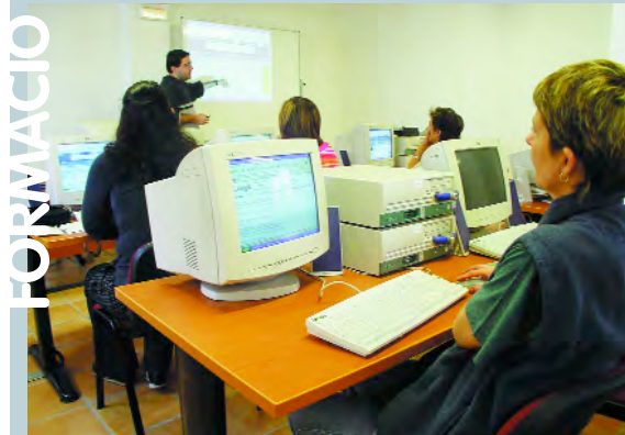
Aula d'Informàtica a l'Alqueria de Moret