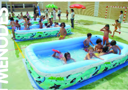
Hora de refrescar-se a l'Escola d'Estiu

En el Centro de Salud de Picanya, poniéndote en contacto con la Trabajadora Social quien te proporcionará más información sobre el programa. Teléfono de cita previa: 961591321.