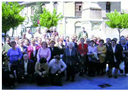
Els nostres majors als carrers de Manises

La inscripció pot realitzar-se de l'1 al 12 de juny a l'Ajuntament on també pot completar-se aquesta informació.