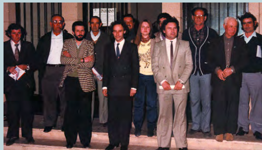
La corporación salida de las elecciones municipales de 1979 ante la puerta del Ayuntamiento

en el ámbito municipal ha supuesto el empleo de mucha imaginación para llevar a cabo la gestión. La financiación local es insuficiente y está mal planteada por parte del Estado. En los Presupuestos Generales de 2004, la Administración central representa el 53,5% del gasto del sector público, las comunidades autónomas el 33,4% y los ayuntamientos el 13%, mientras que la media europea se sitúa en un 20% para los municipios. Los ayuntamientos han adquirido muchas competencias en los últimos años, e incluso por proximidad de la gestión municipal asumen otras que son propias de la Comunidad autónoma o del Estado. Es quizá ahora el momento de elaborar una nueva ley de financiación de las haciendas locales que permita aumentar los recursos económicos para los ayuntamientos. La ampliación de la Unión Europea en 25 Estados y la economía globalizada son, sin duda, dos retos que condicionarán el futuro de los municipios españoles. Picanya, en un mundo en permanente cambio, quiere seguir avanzando, apostando por políticas de bienestar que son en definitiva la base de una sociedad democrática más justa y solidaria.