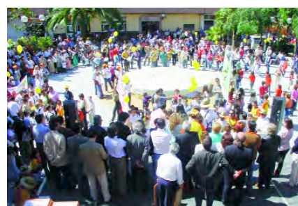
Recepció de les escoles a la Pl. de l'Ajuntament