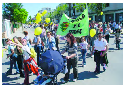
Recorregut pels carrers de Picanya