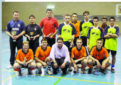
Els dos equips que van disputar la final

Al llarg de la matinal els xiquets i les xiquetes van rebre regals per cortesia de les entitats col·laboradores com ara Aquarius i Pamesa València i per part del club organitzador, el Picanya Bàsquet, cosa que va contribuir a que l'ambient festiu presidira aquest granencontre final.