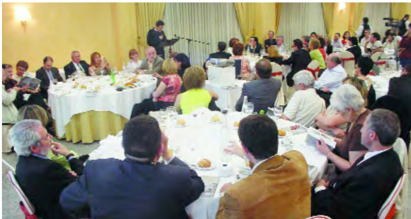
Acte de lliurament dels premis