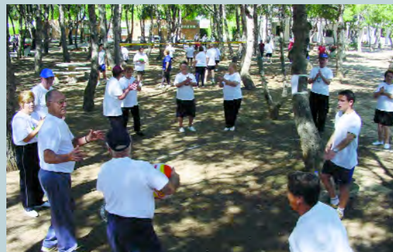
Cada vegada són més les persones majors que fan esport

La inscripció haurà de realitzar-se al Pavelló abans de l'11 de juny i és gratuïta.