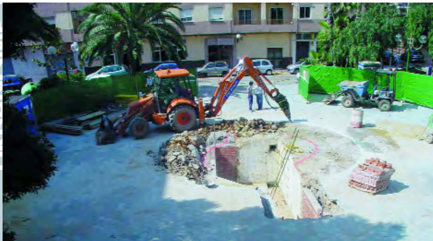
Aspecte de les obres