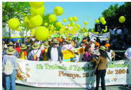
Eixida de la cercavila