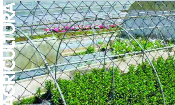
Viver de flors a la zona del Realenc

Per a més informació cal contactar amb l'Agència de Desenvolupament Local.