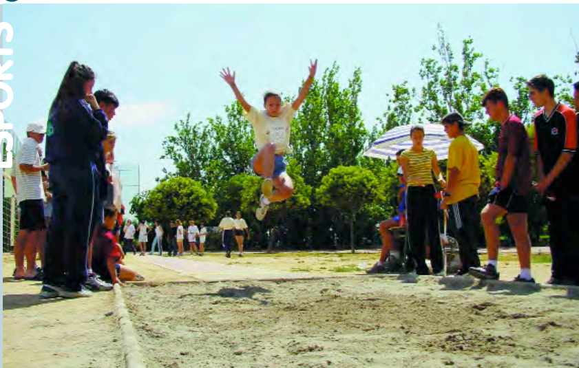
Salt de longitud en els Jocs d'Atletisme al Poliesportiu