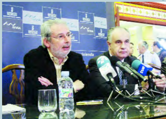
Josep Almenar y el Conseller Rafael Blasco durante la firma del convenio

sota. A les cantonades de la plaça s'han plantat arbusts i arbres de gran mida que donen un aspecte més agradable al conjunt. Sota les zones enjardinades s'ha instal·lat un sistema de reg per degoteig amb programació automàtica que mantindrà la vegetació i estalviarà aigua. Tota la plaça compta amb elements d'enllumenat públic que entonen amb l'entorn.