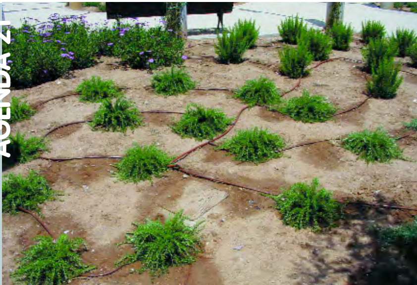
Reg localitzat als jardins de Picanya, una aposta per l'estalvi de l'aigua i per la sostenibilitat