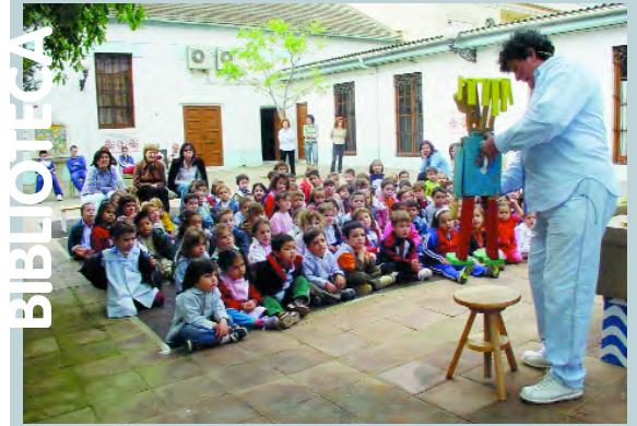
Teatre de titelles per a menuts i menudes al pati de la Casa de la Cultura

Aquests 10 anys d'esforç estan resumits en el llibre Picanya Solidària. 1994-2004 editat per l'Ajuntament i que està a la venda al preu simbòlic d'un euro el qual, evidentment, anirà destinat als fons del Consell.