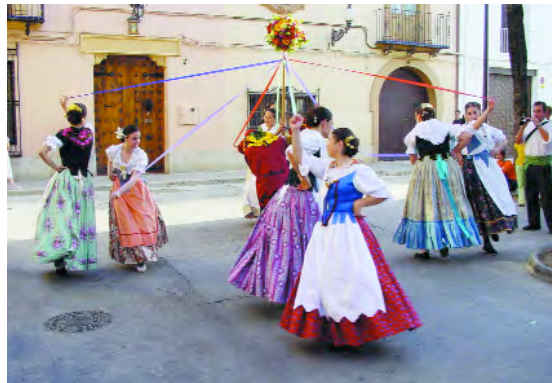
Dansetes del Corpus a la plaça Major