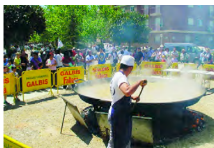
Paella gegant per a recuperar forces