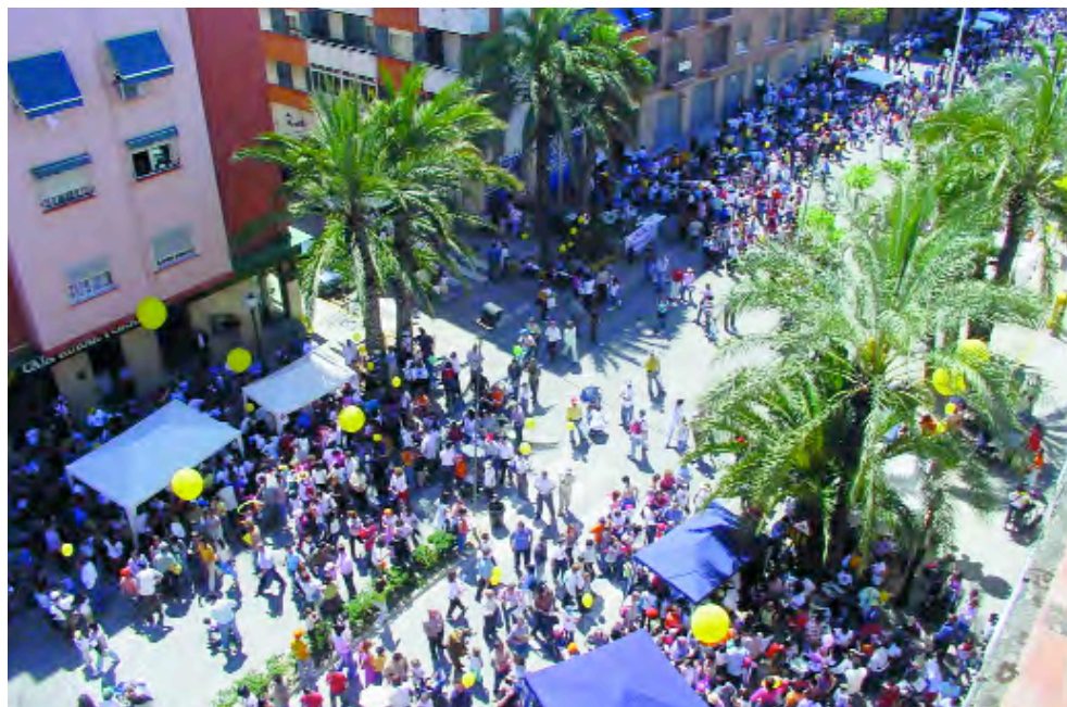
Aspecte de l'Avinguda del Puig durant els tallers