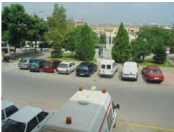
Sota aquesta zona enjardinada es construirà l'aparcament

Hi haurà places en venda, lloguer i per a estacionament regulat