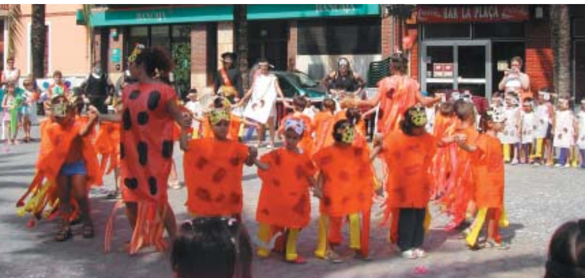
L'alumnat més jove de l'escola d'estiu en la festa de cloenda