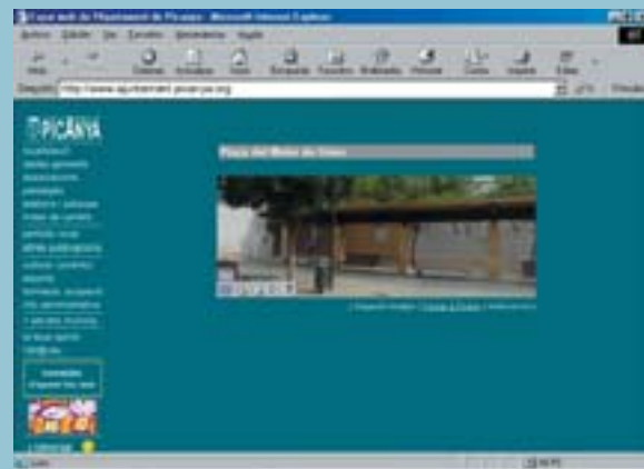
Imatges de 360° a l'espai web municipal

Sin duda, la instalación del ascensor en aquellas fincas que no lo tengan, mejora la calidad de vida de sus habitantes, ya que se trata generalmente de fincas habitadas por personas mayores cuya movilidad no es la misma que cuando adquirieron la vivienda. Para más información, deberán dirigirse al Ayuntamiento.