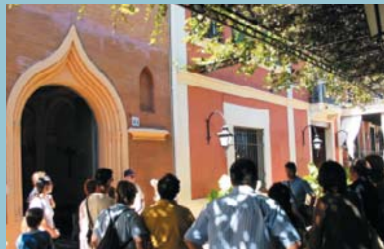
Explicació a la porta de la capella de l'Hort de Pla

Amb aquesta iniciativa es pretén contribuir al coneixement i l'estima del patrimoni dels diferents municipis als seus veïns i veïnes i oferir un recurs didàctic més per a l'educació en els valors de respecte a la herència cultural que tenim al nostre entorn.