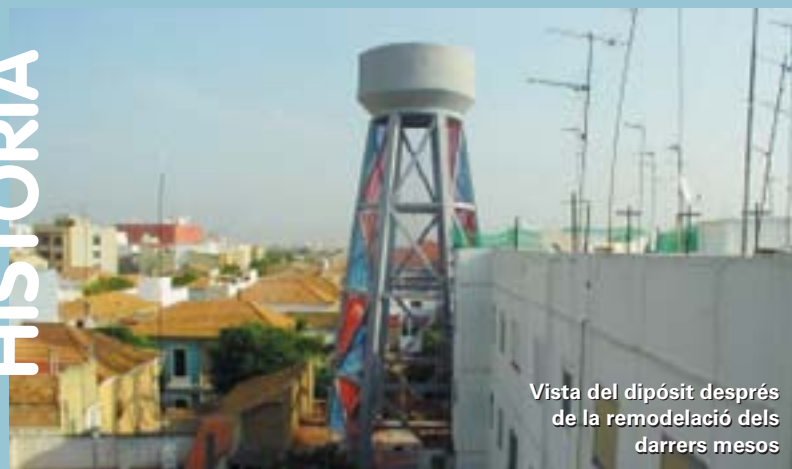
Vista del dipòsit després de la remodelació dels darrers mesos