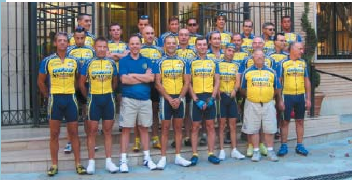
Els membres del club abans d'eixir cap a Andorra

L'acomiadament tingué lloc al pati de l'Alqueria de Moret amb un sopar de germanor entre totes i tots els participants, i abans d'eixir cap a Panazol tinguérem temps de gaudir de la "coetà".