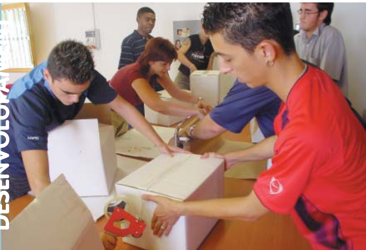
Curs de gestor de magatzem