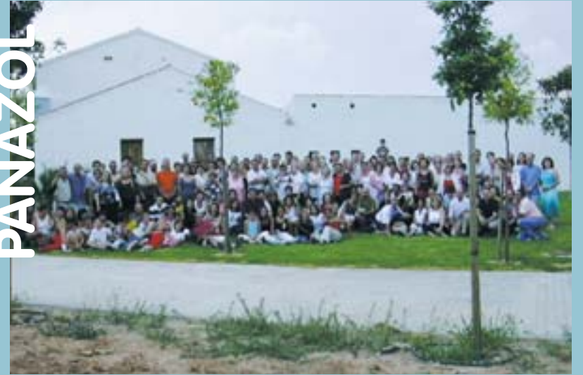
Panazolencs i picanyers poc abans de l'acomiadament

Un esport aquest de l'automobilisme que necessita una gran dedicació i un gran esforç en què, afortunadament, els joves pilots picanyers no estan sols, donat que compten amb el suport dels seus patrocinadors sense els quals seria impossible assolir aquest nivell d'èxits.