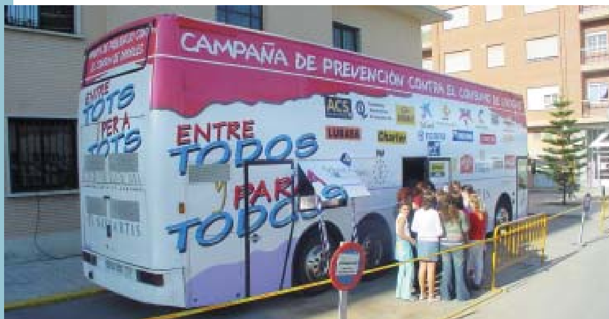
Alumnat de l'institut visitant l'autobús