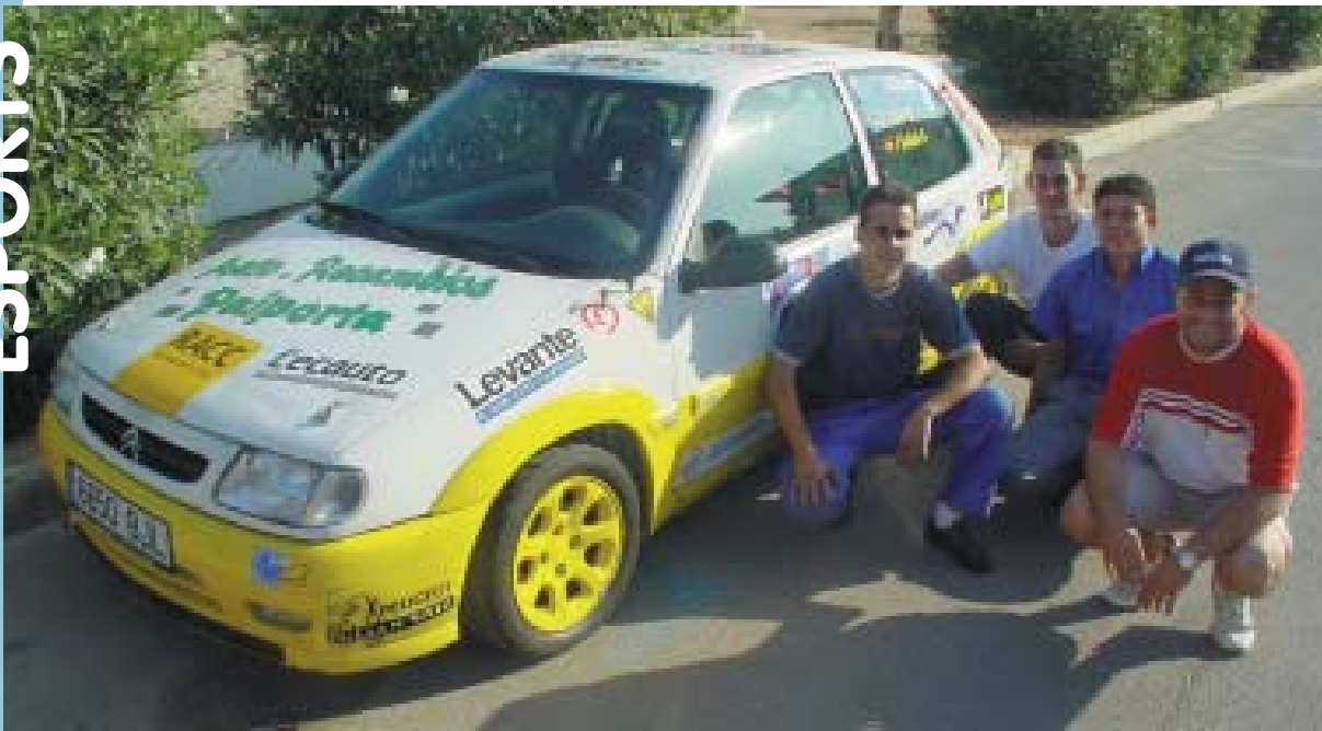
Els pilots picanyers junt a un dels seus vehicles