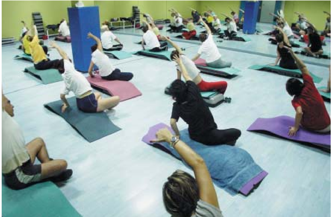
Grups de gimnàstica al Pavelló