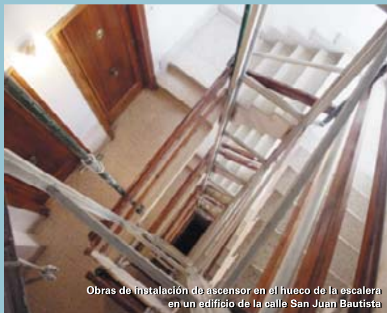
Obras de instal·lació de ascensor en el hueco de la escalera en un edificio de la calle San Juan Bautista

Els vianants accediran a l'aparcament per tres escales. Les persones amb mobilitat reduïda podran entrar a l'aparcament i eixir-ne per un ascensor. Aquest ascensor estarà situat prop de les places d'aparcament reservades per a discapacitats. Els accessos per a les persones, se situaran junt al Mercat i junt a l'Ajuntament, on estarà també l'ascensor. Una vegada finalitze la construcció de l'edifici soterrani de l'aparcament, es restituirà el tram de l'avinguda Sanchis Guarner afectat per les obres al seu estat original.