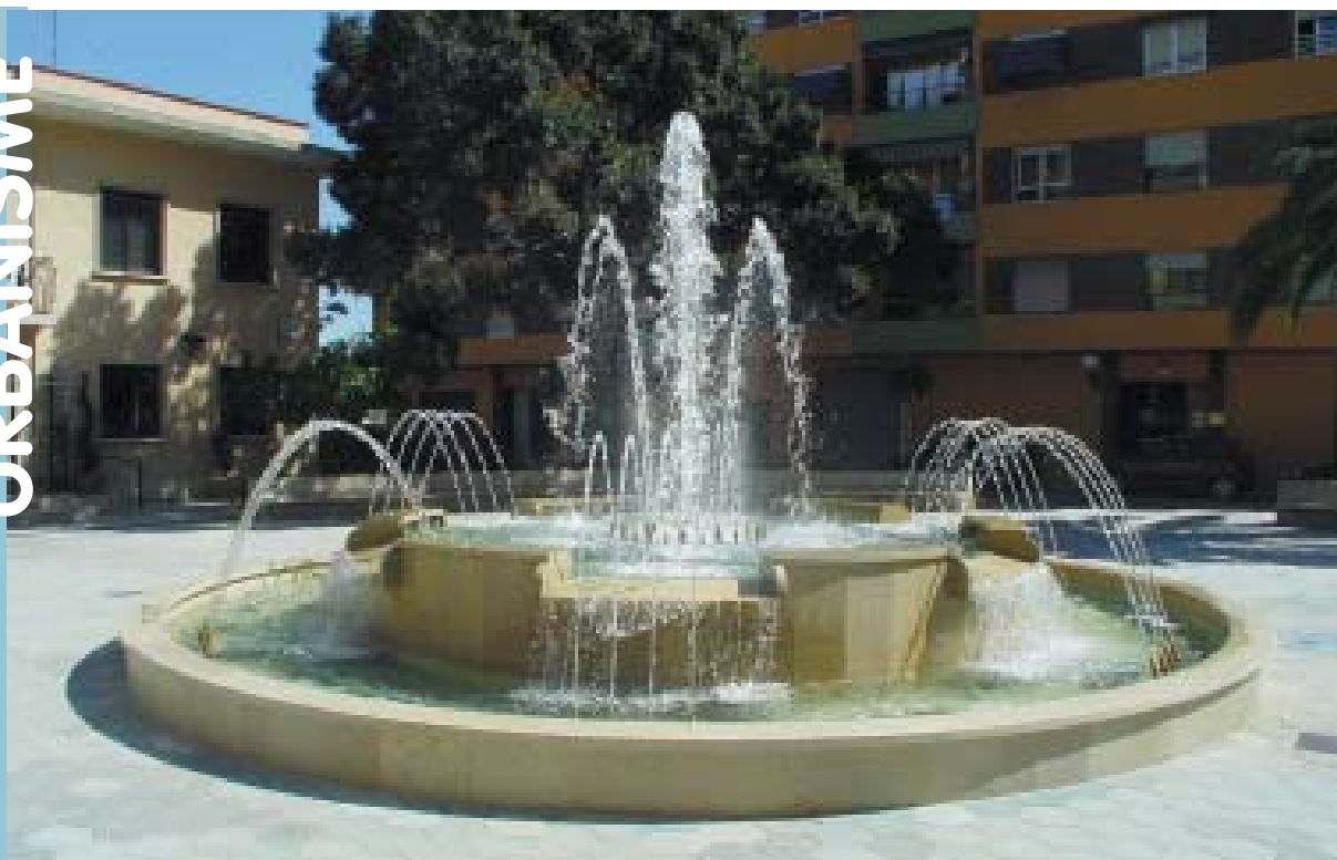
La font de la plaça de l'Ajuntament Il·luix totalment renovada