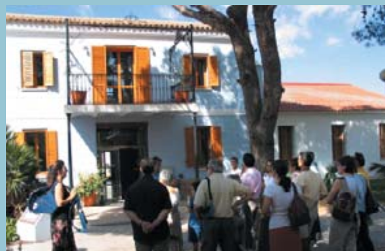
El grup a les portes de l'Alqueria de Moret

L'alqueria de Moret de Picanya és una mostra del que s'anomena patrimoni etnològic, ja que es tracta d'una antiga alqueria d'horta, que es trobava en ruïnes i que va ser adquirida i rehabilitada per l'Ajuntament de Picanya mitjançant un programa d'escoles taller i cases