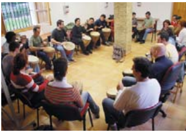
Curs de percussió africana per a joves