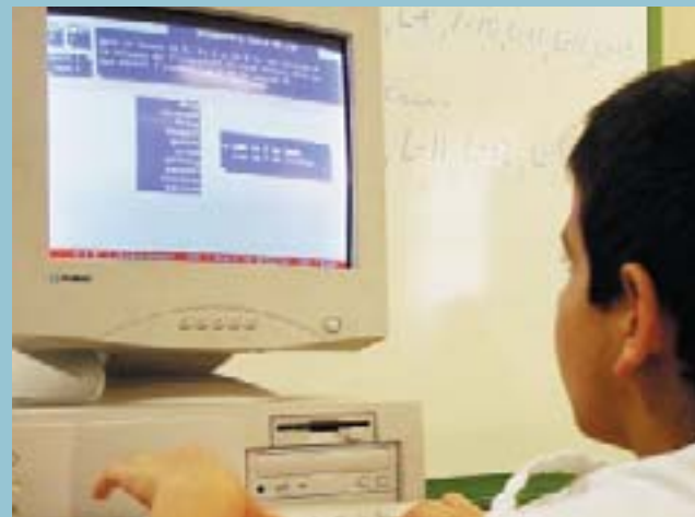
De nou a estudiar

L'autobús va estar a Picanya desde les 9.00 fins a les 17.00 h i va rebre la visita de més de 130 alumnes de l'IES i de les escoles de Picanya que van rebre d'aquesta manera el millor material a l'hora de prevenir el perjudicial ús de les drogues: la informació.