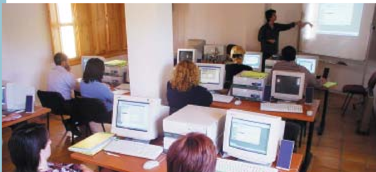
Aula d'informàtica de l'Alqueria de Moret

Per a més informació cal adreçar-se a l'ADL de l'Ajuntament de Picanya, al Centre Alqueria de Moret, bé personalment bé per telèfon 961295400, abans del 18 d'octubre.