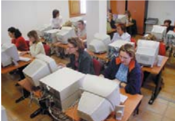
Curs d'informàtica a l'escola d'adults