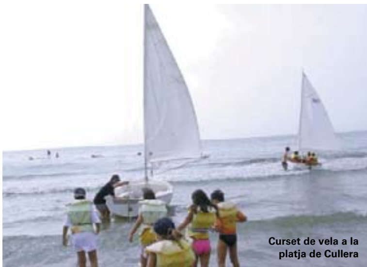
Curset de vela a la platja de Cullera

seres...) i excursions com ara les realitzades a Cullera (on van realitzar un curset de vela), al parc aquàtic de Sogorb... en un "sense parar" d'activitats.