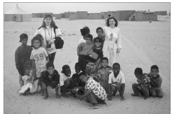
Una delegación de Picanya visitó los campamentos de Tindouf.

"El 70 por ciento de las personas que se encuentran en Tinduf son niños y niñas. Viven dentro de tiendas de campaña. Las condiciones son tan duras que sólo sobreviven los más