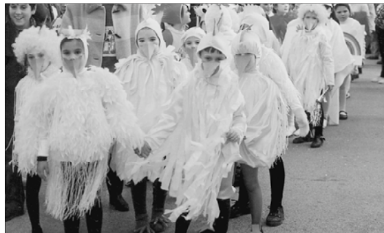
Picanya va bullir de color i fantasia durant el carnestoltes.

da va eixir des de l'Ausiàs March, i es va afegir a les comparses de la resta dels centres front al col·legi Sorolla, des del qual tots els disfressats desfilaran fins a la plaça del País Valencià i després gaudiran d'una festa dins dels recintes escolars.