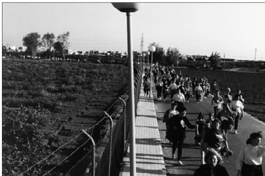
Un moment del Recreo-Cros de la Dona a Picanya.

moració del 8 de març, Dia Internacional de la Dona Treballadora. Aquesta prova lúdico-esportiva no té un caràcter competitiu, ja que el seu objectiu princi-