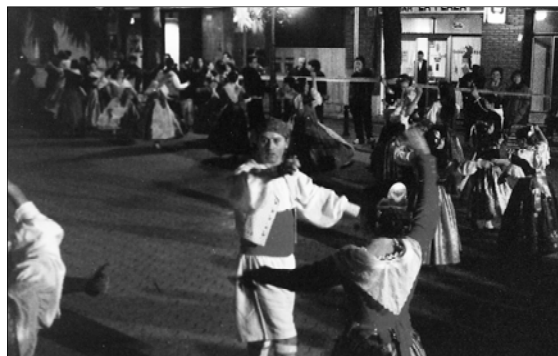
sus danzas la calle Sant Josep hasta llegar a la plaza del País Valencià, donde prepararon una actuación especial.

Los participantes en la Dansà 97 recorrieron con sus bailes típicos las calles del municipio. Concretamente, los bailarines de los grupos participantes en el acto y que cada año son invitados a la Dansà por los conjuntos organizadores, recorrieron con